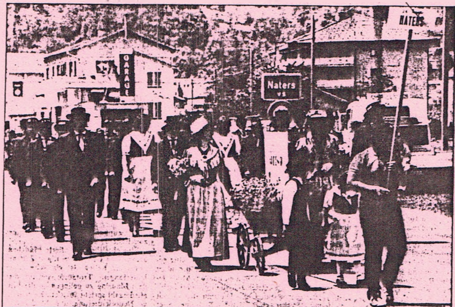
Die letzten drei Tage standen in Naters ganz im Zeichen des 27. kantonalen Jodlertreffens — Gleichzeitig feierte der Jodlerclub «Aletsch» sein 20jähriges Bestehen.