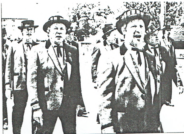
Begeisterte Zuschauer spendeten jeder der vorbeiziehenden Jodlergruppen Beifall.

Die Walliser Jodlervereinigung zeigt sich vom Gebotenen erfreut und dankt für die uneigennützigte Arbeit im Dienste unseres Brauchtums.